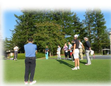
懇親ゴルフコンペ