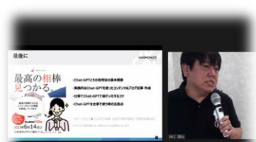
初心者向け「Chat-GPT」勉強会