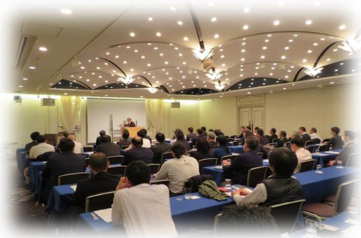
著名人を招いた講演会