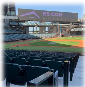
北海道ボールパークFビレッジ/ダイヤモンドクラブラウンジ