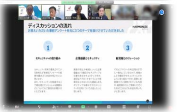
セキュリティセミナー