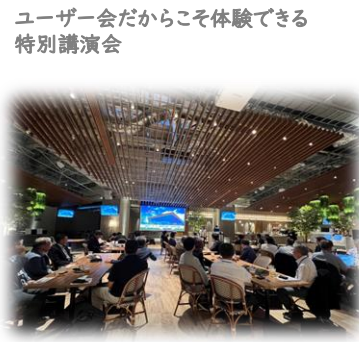
ユーザー会だからこそ体験できる 特別講演会